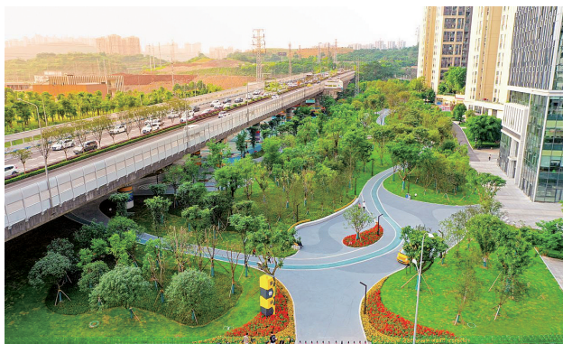
渝北区渝鲁高架桥下游园

“这些最美在每个市民身边，是民生实事办理效果的证明，是美丽重庆的生动诠释。”该负责人说。