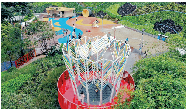
大渡口区快乐羽李公园