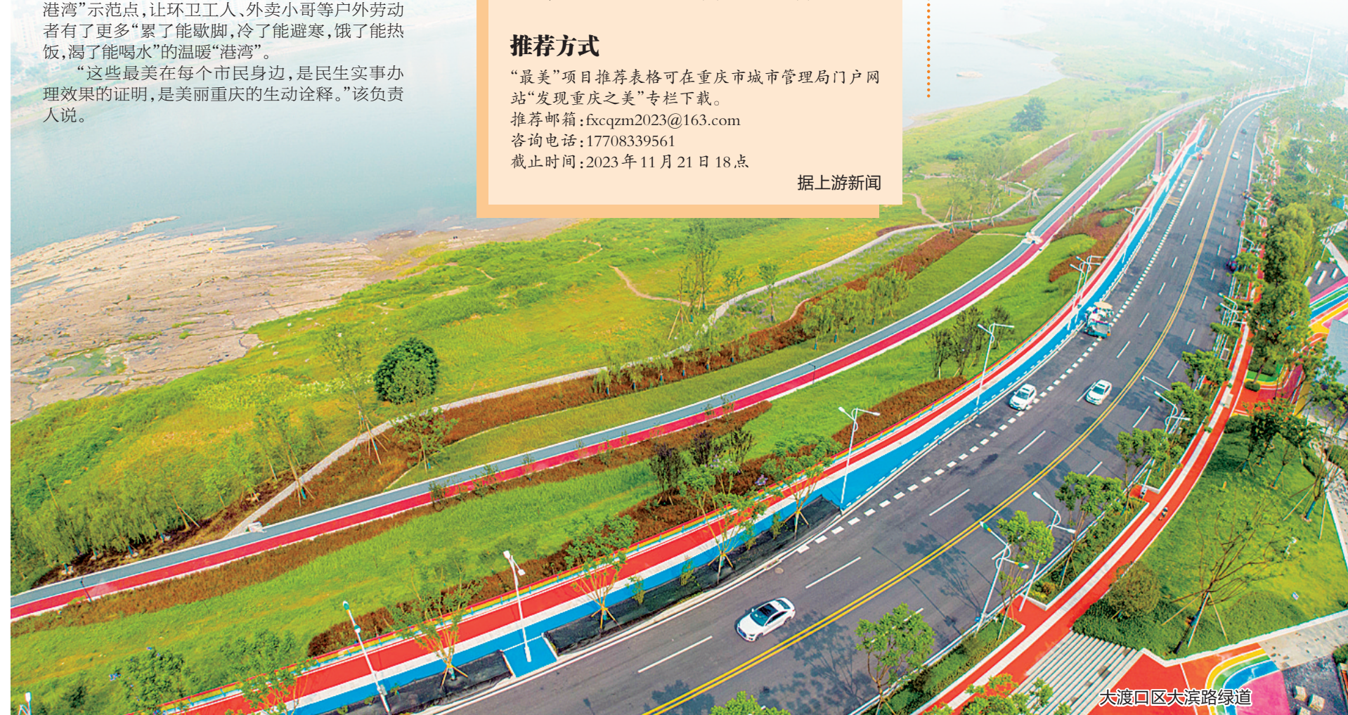
大渡口区大滨路绿道