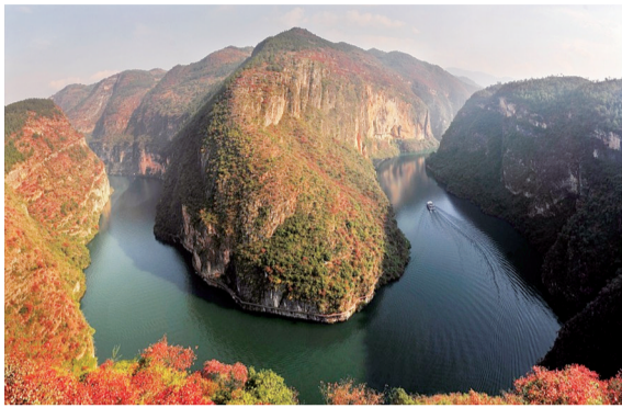
巫山小三峡鱼头湾

据巫山县林业局相关负责人介绍，目前巫山正结合“两岸青山·千里林带”建设总体方案，持续打造巫山红叶景观带，进一步丰富红叶、红果树种，力争让巫山峡江沿岸形成“春秋赏红叶、夏赏红花、秋冬赏红叶红果”的四季有红美景，让长江母亲河更加靓丽怡人。