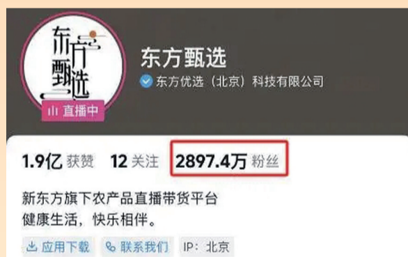
東方甄選粉絲回升

繼16日晚俞敏洪與董宇輝直播間合体之後，18日晚，董宇輝與俞敏洪再度同框直播。數據顯示，董宇輝回歸東方甄選直播間人數超300萬。