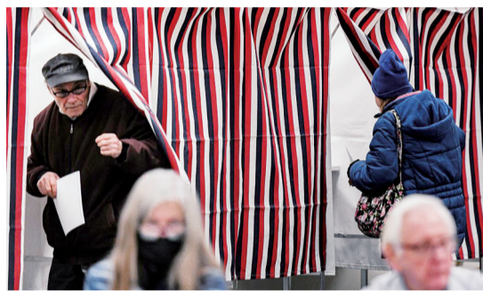
1月23日，选民在美国新罕布州曼彻斯特市一处投票站参加共和党初选投票。

会被放大和升温。哈佛大学美国政治研究中心—哈里斯民调结果显示，移民问题是当前美国选民关注的最重要议题。分析人士认为，得州与白宫对抗结果可能对美国今年总统选举产生重大影响。