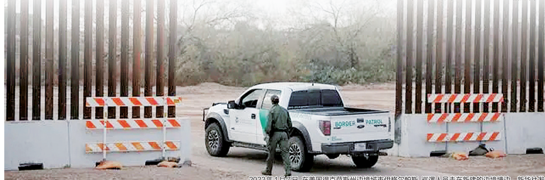
2022年1月7日，在美国得克萨斯州边境城市伊格尔帕斯，巡逻人员走在新建的边境墙边。