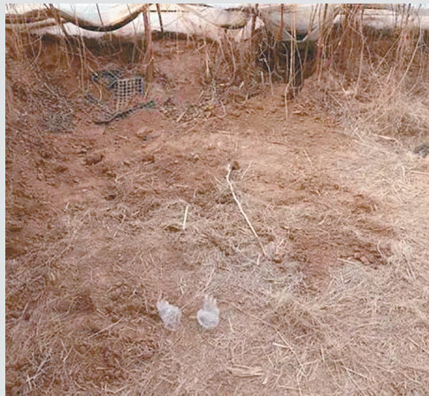
埋尸现场已被填平