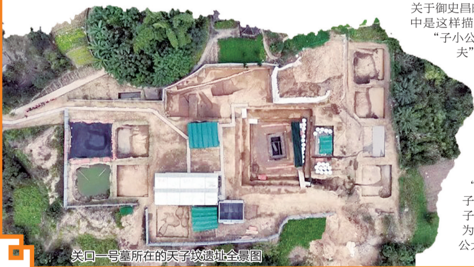
关口一号墓所在的天子坟遗址全景图

为什么要对御史昌的身份刨根问底？白九江说，关口一号墓出土木牍提供的信息，为西汉初期官、爵对应关系提供了重要的参考案例，也为相应等级墓葬规格判断提供了标准。新重庆-重庆日报记者 李晟