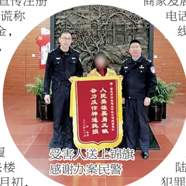
受害人送上锦旗感谢办案民警

2022年9月，北碚警方开展集中收网行动，一举抓获犯罪嫌疑人4名。2023年10月下旬，其余3名犯罪嫌疑人也陆续投案自首。目前，此案主要犯罪嫌疑人张某等人因涉嫌合同诈骗罪已被公安机关依法执行逮捕，案件已被移送检察机关审查起诉。