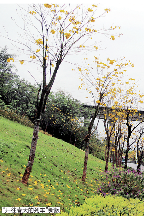
“开往春天的列车”新版

在渝宜高速江北唐家沱互通至铁山坪森林公园路旁，放眼望去蔚为壮观，当渝怀线上有列车经过时，幸运的游客还可以拍到最新版“开往春天的列车”。