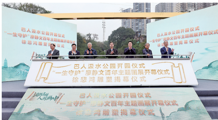
4月10日，徐悲鸿艺术街区巴人汲水公园开园仪式在江北区举行。

4月10日，徐悲鸿艺术街区巴人汲水公园开园仪式在江北区举行，徐悲鸿旧居“一生守护”廖静文百年主题画展在当天同时开幕。市政府副市长但彦铮，原致公党中央副主席杨邦杰，江北区委书记滕宏伟，区委副书记、区政府区长陶世祥，徐悲鸿纪念馆馆长徐庆平以及市区相关部门负责人，社会各界受邀嘉宾等近100人出席本次活动。