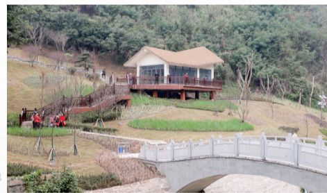
市民在巴人汲水公园里游玩