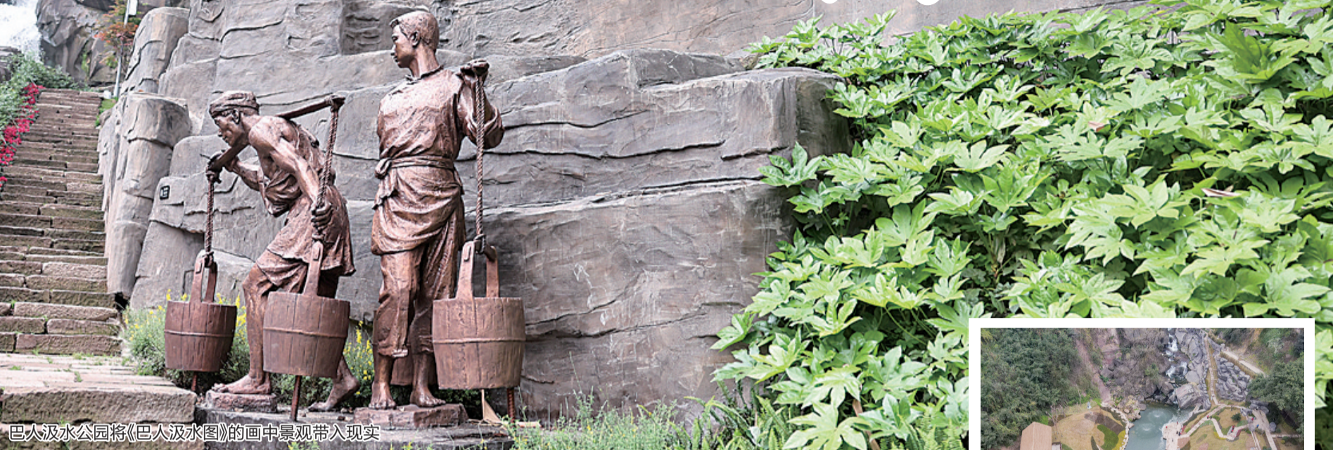
巴人汲水公园将《巴人汲水图》的画中景观带入现实