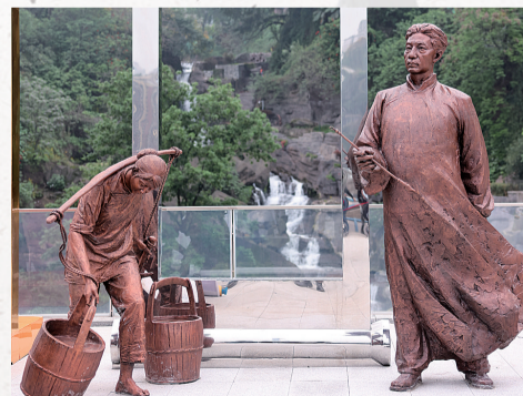
透过镂空画卷还原《巴人汲水图》