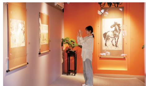
市民参观徐悲鸿旧居“一生守护”廖静文百年主题画展