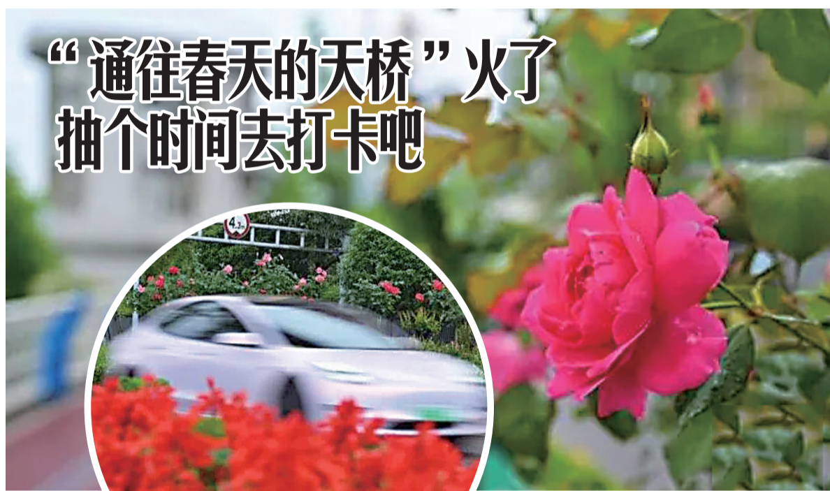
步道旁边的月季花