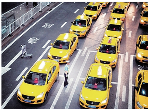
黄色出租车大排长龙,只为把每一个你安全护送。