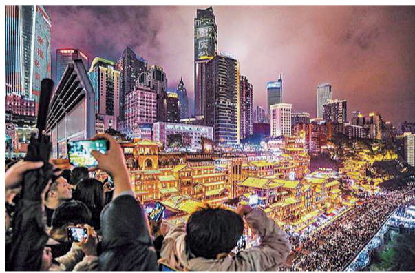
担心假期人挤人? 那就请市民支持,让桥让路。

最终,中国旅游研究院发布的“2023年游客满意度十佳城市”分别是:苏州、杭州、厦门、昆明、重庆、青岛、西安、南京、北京、沈阳。