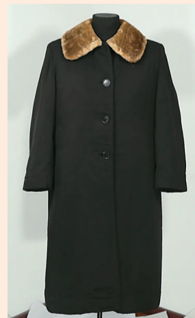
展馆现场以及展馆内的文物

到了各民主党派和爱国民主人士的热烈响应。为了以实际行动响应中共中央“五一口号”，各民主党派及各界爱国民主人士纷纷北上，筹备召开新政协会议。