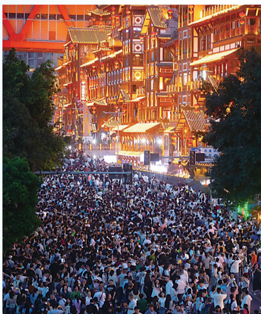
夜晚的洪崖洞民俗风貌区游人如织

2024年五一期间,重庆市商务系统聚焦“乐购、乐车、乐玩、乐游”消费主题,组织开展多场“爱尚重庆·赏春消费季”主题消费促进活动,节日消费市场活力迸发,人气旺盛。渝中区投入20亿促销优惠,实现人气市场双兴,解放碑商圈迎客450万人次,日均客流同比增长5%,美团数据显示其消费热度排名全国第一;江北区各大商超促销让利1.5亿元,参与活动人数超500万人次。据监测显示,五一期间,全市消费总额比去年同期增长8.1%。