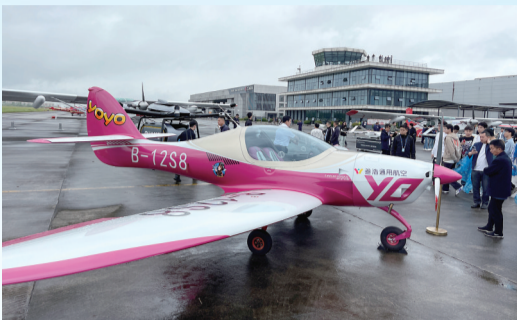
市民观看展示飞机