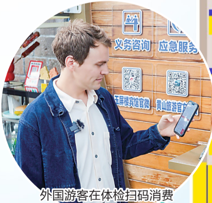
外国游客在体检扫码消费