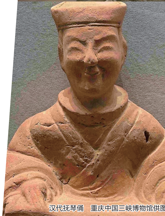
汉代抚琴俑

重庆人的松弛感和乐观由来已久，是刻在老祖宗的DNA里的。5月8日是“世界微笑日”，重庆中国三峡博物馆专程从正在展出的《妙手匠心 重现华光——三峡出土文物保护利用展》中，精选出数件来自汉代至南北朝时期的陶俑推荐给市民，让它们带你穿越千年，领略古人的笑容。