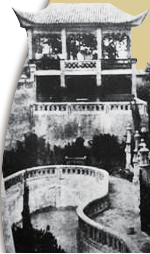
▼民国年间的中央公园