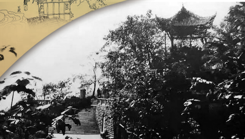
1950年前后的人民公园