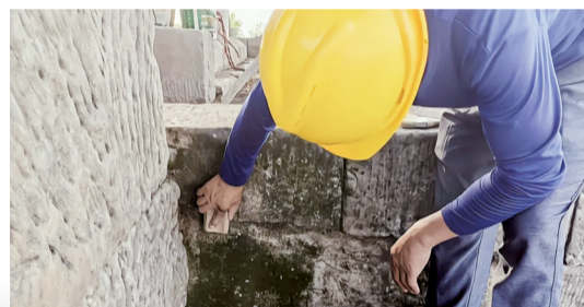
文物修复工人正在施工