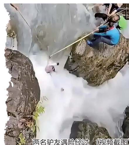
两名驴友遇险经过（视频截图）