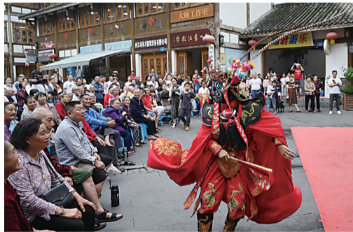
游客欣赏川剧变脸