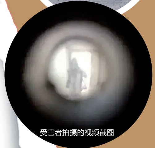
受害者拍摄的视频截图