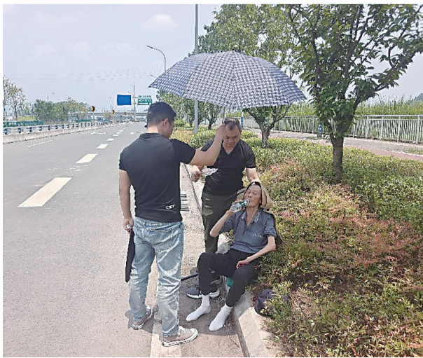
6月15日下午1点,重庆驿满新能源公司巡检人员在内环快速路对八旬中暑老人进行急救。