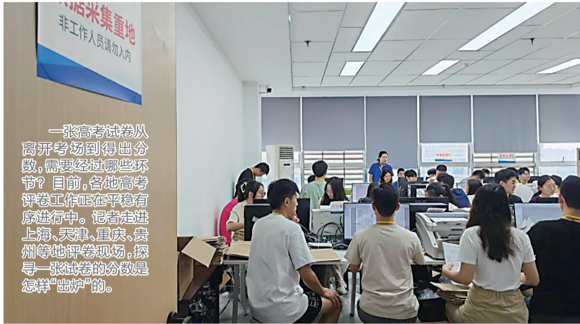
在重庆市西南大学评卷点,工作人员正在进行试卷扫描工作。

一张高考试卷从离开考场到得出分数,需要经过哪些环节?目前,各地高考评卷工作正在平稳有序进行中。记者走进上海、天津、重庆、贵州等地评卷现场,探寻一张试卷的分数是怎样“出炉”的。