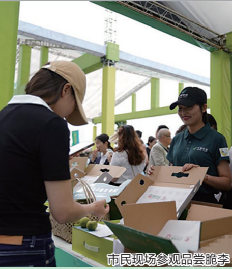
市民现场参观品尝脆李