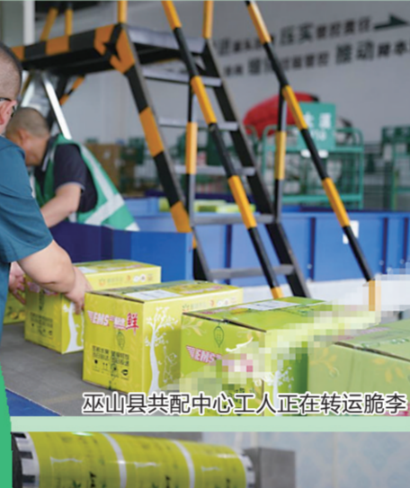
巫山县共配中心工人正在转运脆李