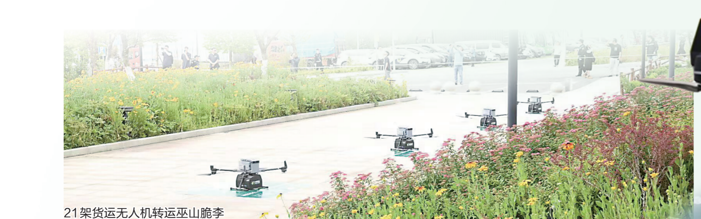
21架货运无人机转运巫山脆李