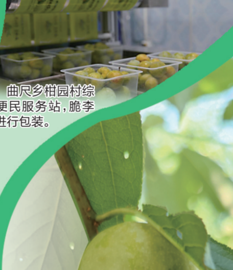
曲尺乡柑园村综合便民服务站，脆李在进行包装。