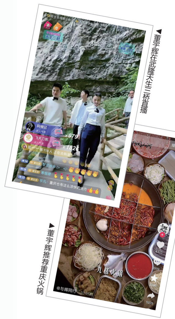
董宇辉在武隆天生三桥直播

“重庆太美了”“一定要去一次重庆”“重庆还有很多美景值得推荐”……在当天的直播间，网友也纷纷点赞重庆。 按计划，本次“与辉同行阅山河”重庆站直播将一直持续到7月4日。3日13:00-14:30、16:30-19:00、20:00-22:00，以及4日15:00-17:00、21:00-24:00均有董宇辉直播。