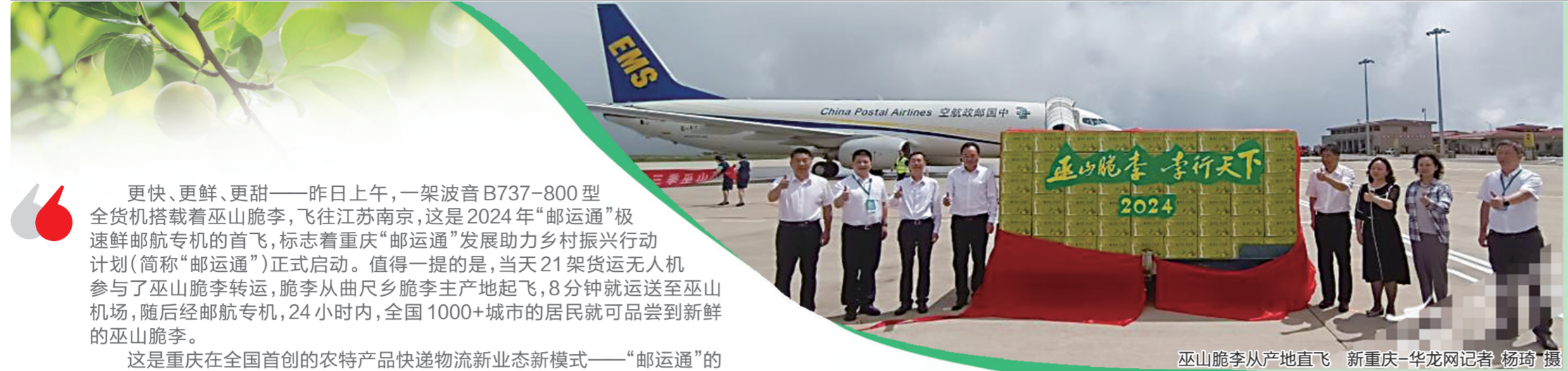
巫山脆李从产地直飞

据重庆市商务委相关负责人介绍，重庆早在一个多月前，就全面启动选品工作，经过精挑细选，最终确定了300余个山城特色产品，包括农产品、食品、日用品、工业消费品、生活服务等多个品类。“本次活动是重庆优质商品集体亮相的难得机会。”该负责人表示，这些产品经过重重挑选，在抖音店铺综合评分、商品体验、月销量都有严格要求，因此亮相“与辉同行”直播间的产品，都是极具重庆代表性的山城好食品品。 新重庆-上游新闻记者 裴晋奕 王梓博