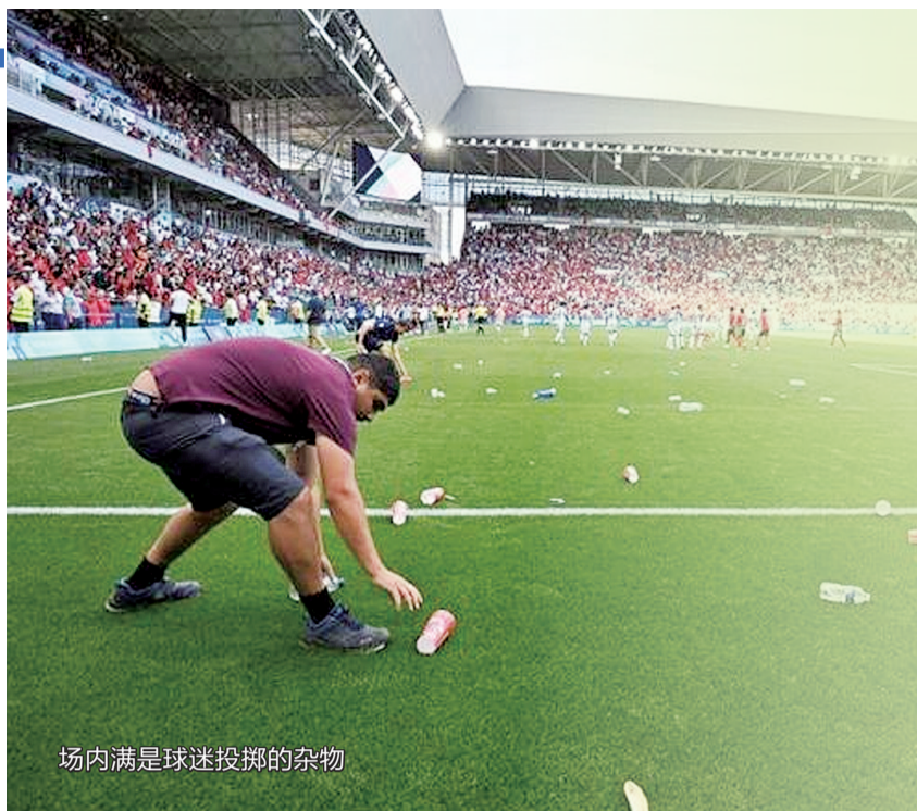
场内满是球迷投掷的杂物