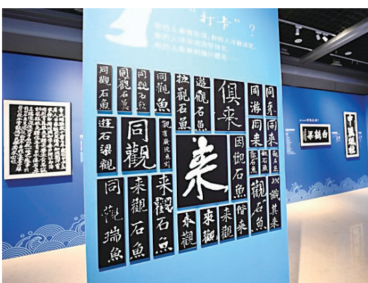
展览还对古人在白鹤梁上题刻中“打卡”的表达进行了盘点