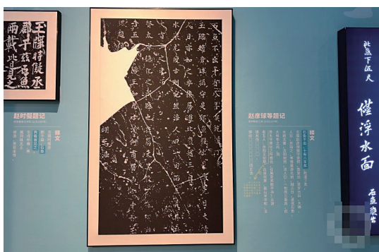
有题刻显示石鱼最长十八年、最短两年出水可见