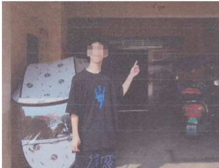
易晓指认作案现场