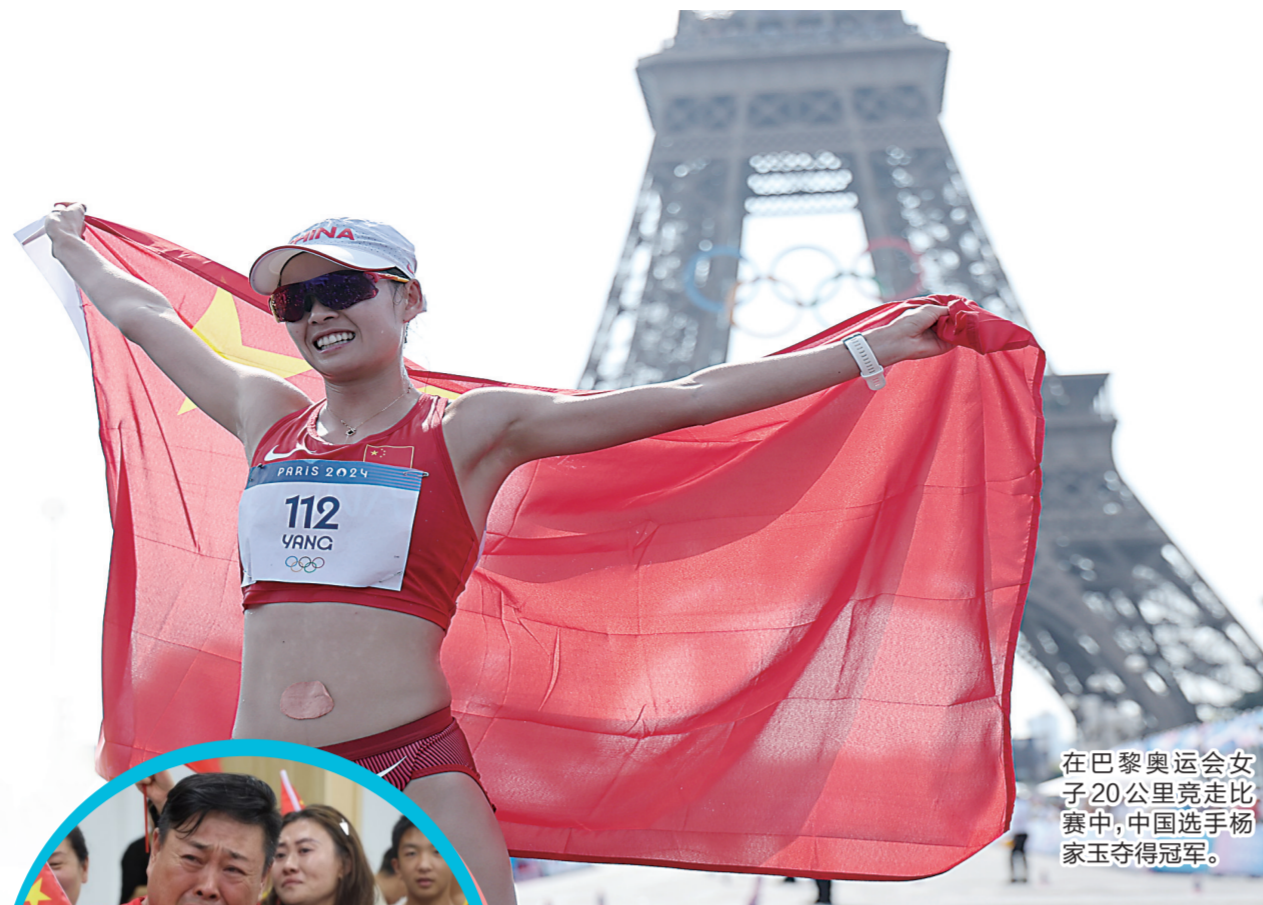
在巴黎奥运会女子20公里竞走比赛中，中国选手杨家玉夺得冠军。

在北京时间8月1日结束的巴黎奥运会女子20公里竞走比赛中，中国选手杨家玉以1小时25分54秒的个人赛季最好成绩，帮助中国队在田径首日便取得完美开局，这也是中国代表团本届奥运会第11枚金牌。这场决赛，杨家玉夺冠优势可谓一骑绝尘。第2名的西班牙选手佩雷斯，被她甩开了多达25秒。杨家玉不仅是一名运动健将，还是一名退役军人，昨天是八一建军节，中国人民解放军97岁的生日，内蒙古乌海姑娘用这枚金牌为建军节献上了贺礼。你可能不知道的是，这位被称作“全世界颜值最高的竞走运动员”的爸妈，竟然是地地道道的重庆人！不少网友释然道：“难怪颜值那么高！”