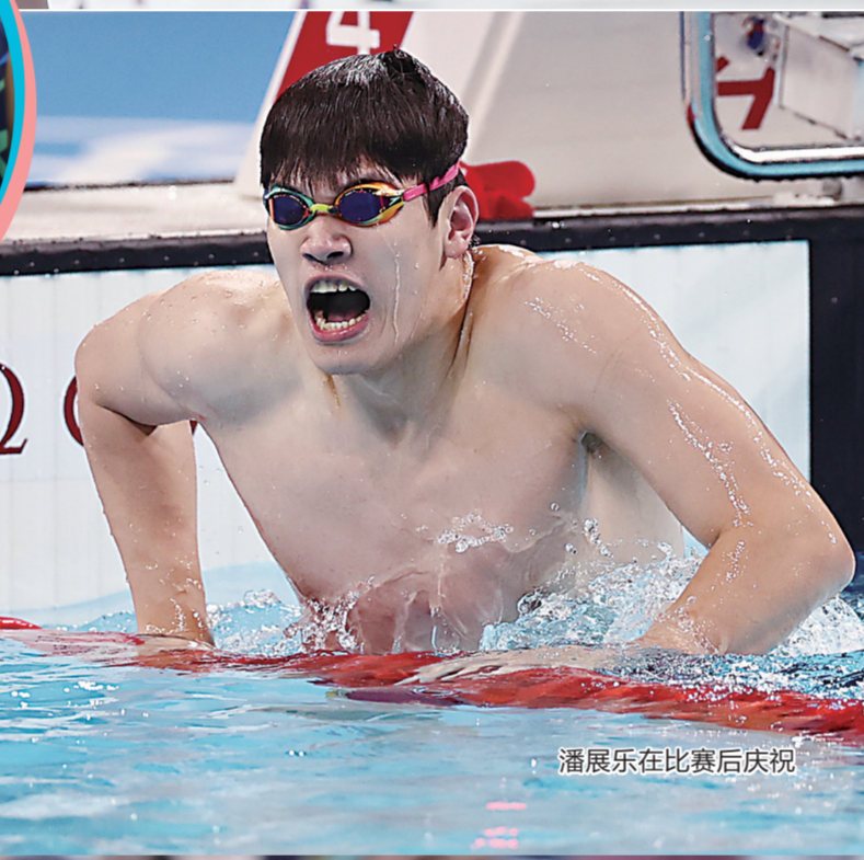
潘展乐在比赛后庆祝