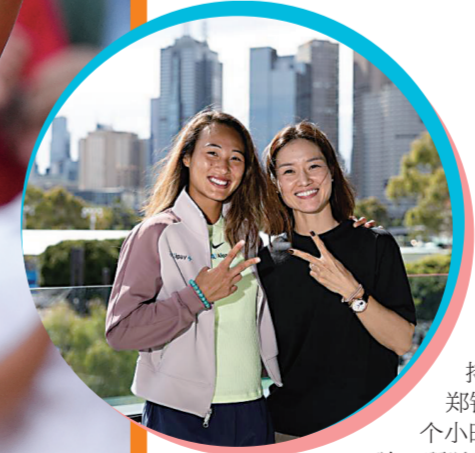
郑钦文与李娜合影

郑钦文2002年10月8日出生在湖北十堰市，2017年进入湖北网球队。2024年，郑钦文获澳网亚军，世界排名跃升第7，在法国网球公开赛