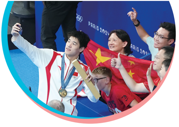
中国选手潘展乐与观众合影

46秒40！巴黎奥运会游泳项目开赛以来的首个世界纪录诞生了！潘展乐振臂高呼，拉德芳斯体育馆掌声雷动。7月31日晚的男子100米自由泳决赛，19岁的潘展乐打破自己保持的世界纪录，为中国游泳队夺得巴黎奥运会的首枚金牌。赛后，潘展乐最大的感受是如释重负：“我现在的感觉就是爽！真好！”