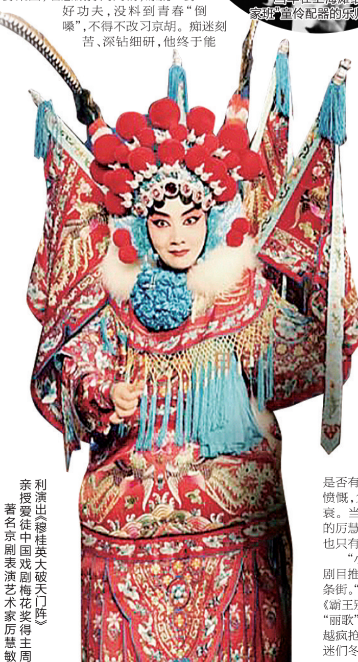
利演出《穆桂英大破天门阵》 亲授爱徒中国戏剧梅花奖得主周著名京剧表演艺术家厉慧敏