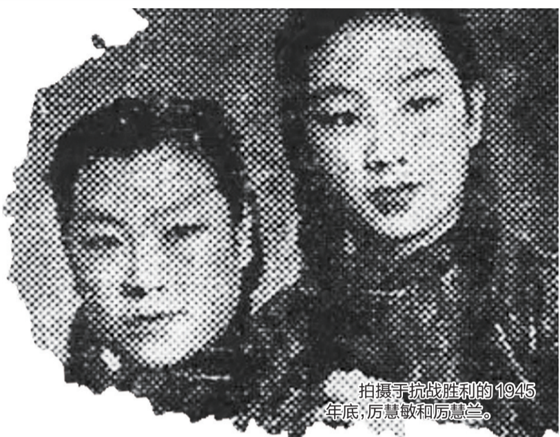
拍摄于抗战胜利的1945年底，厉慧敏和厉慧兰。

2007年3月26日，厉慧敏走完她83岁的一生。今年9月10日，是京剧大师厉慧敏百岁寿诞，我们不仅怀念她，更要永远铭记她在赓续弘扬国粹上做出的贡献和努力。 (作者系《现代工人报》原社长)