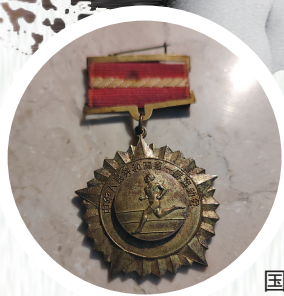
获得的第一届全国运动会冠军奖章