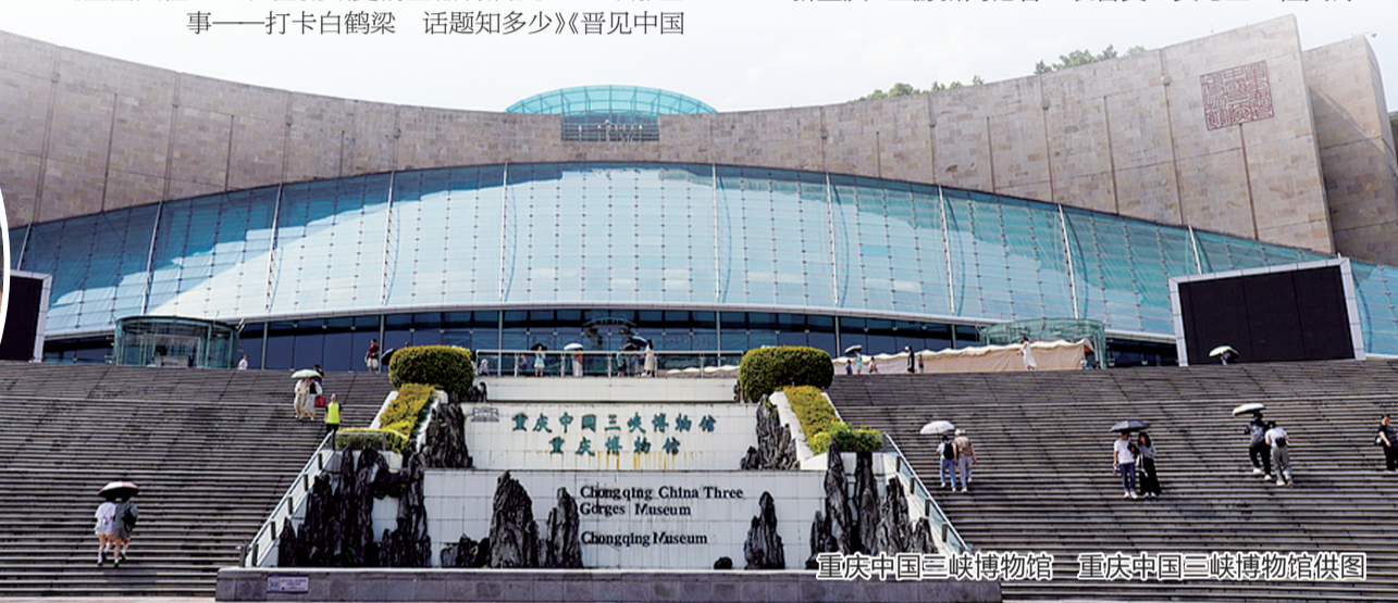
重庆中国三峡博物馆