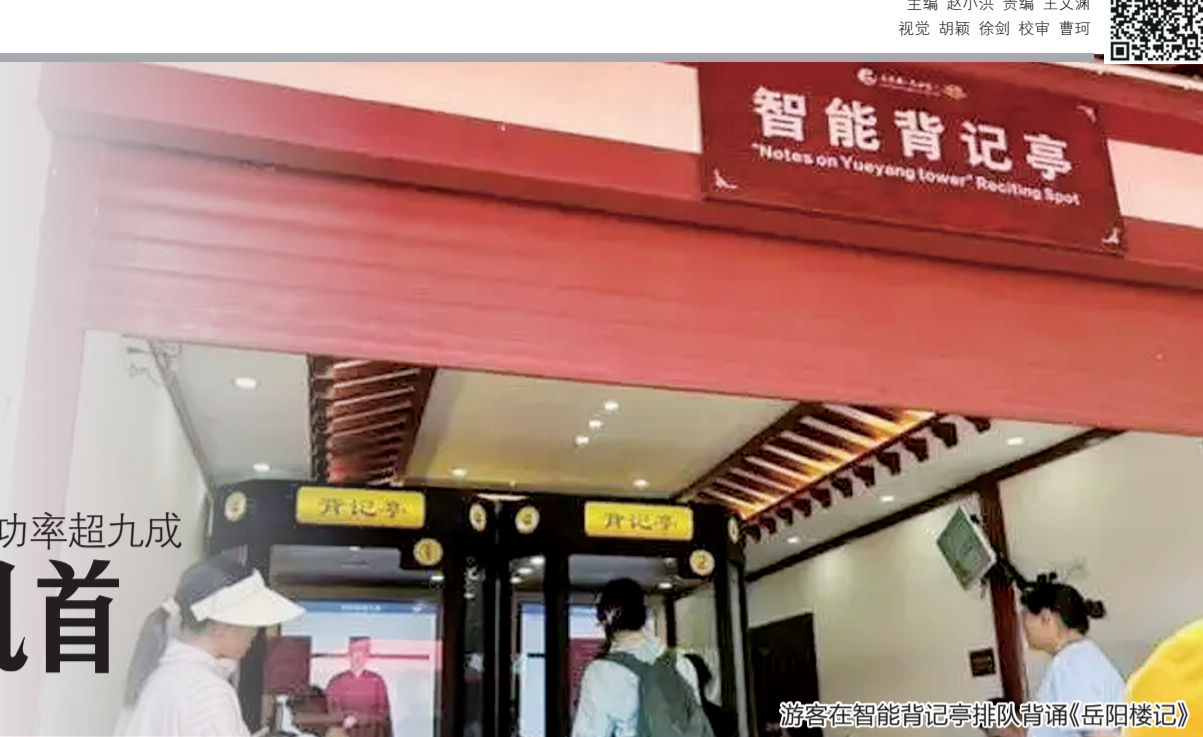
游客在智能背记亭排队背诵《岳阳楼记》