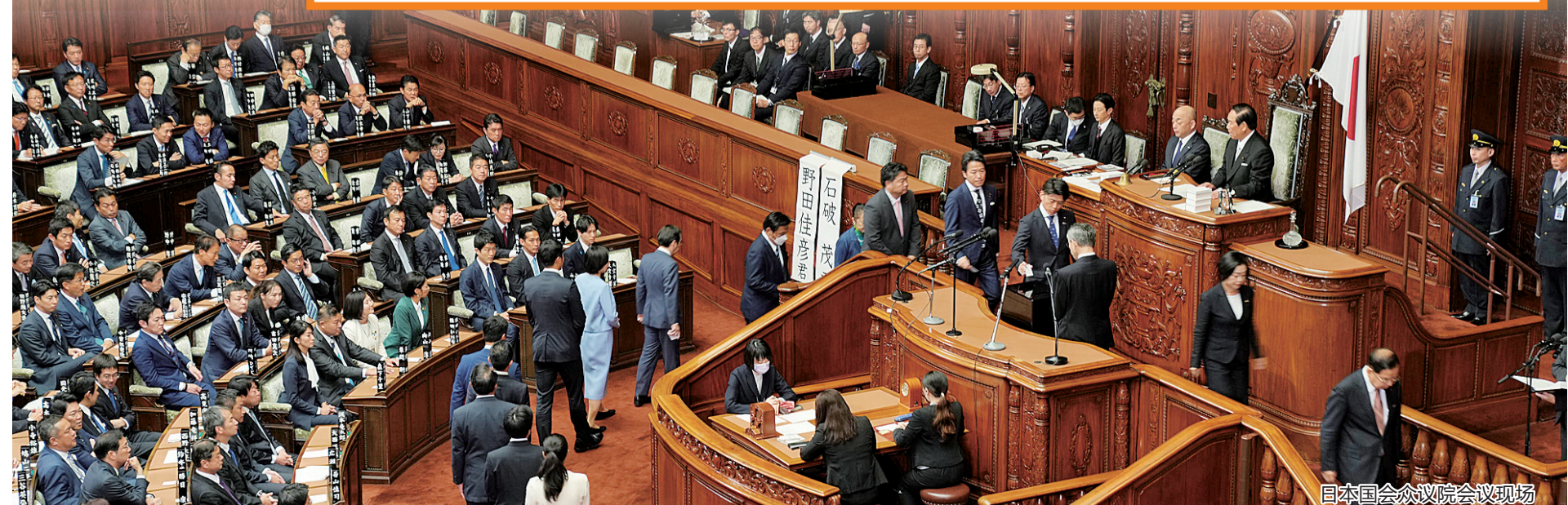
日本国会众议院会议现场