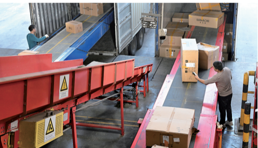
德邦将老旧的装卸设备进行了更新升级，操作效率提升20%。