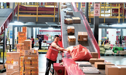
智能化设备的加持，让京东物流亚洲一号重庆分拣中心的分拣效率大幅提升。

每年“双11”都是一场购物狂欢，而今年“双11”被称为史上周期最长的购物节，各大电商平台将促销时段拉长至1个月左右。在这样的物流高峰期，快递行业的营运呈怎样一个状态？为了尽快地将物件送达用户手中，他们又作了哪些努力？11月10日晚，记者实地探访了德邦、京东、申通三个快递龙头企业的重庆分转中心，见证了他们的繁忙与从容。