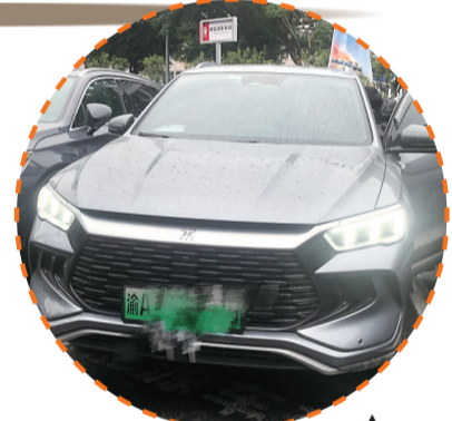
杨先生正在开的车辆