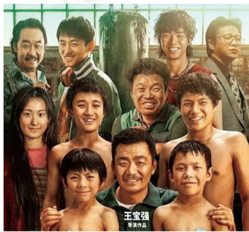
《八角笼中》宣传海报