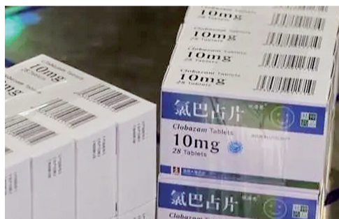
进入国家医保药品目录的氯巴占