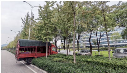
货车堵住人行道口