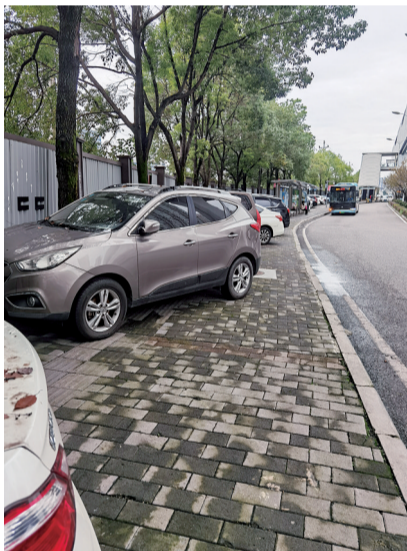
轨道交通康庄站被车辆霸占