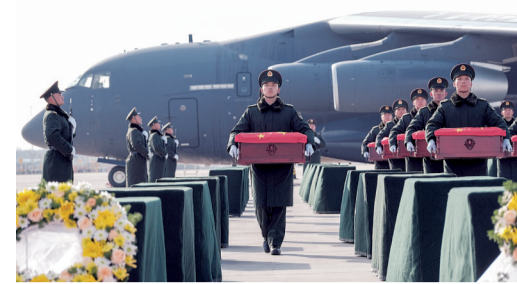
在沈阳桃仙国际机场，礼兵将殓放志愿军烈士遗骸的棺槨从专机上护送至棺槨摆放区。

第十一批在韩中国人民志愿军烈士遗骸迎回仪式28日在沈阳举行。43位志愿军烈士遗骸及495件遗物由我空军专机从韩国接回至辽宁沈阳，回到祖国怀抱。