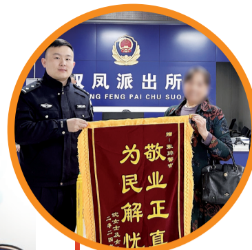
沈女士送锦旗感谢民警