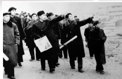
周恩来考察南津关坝区

看着钱正英没有发言，周恩来便点名道：“钱正英你怎么看呢？”钱正英不仅是水电部领导，也是水利专家，她说：“赞成修建三峡水利工程，但还不具备上马条件，应积极准备，应干支流结合、大中小工程结合，长江的防洪问题关系