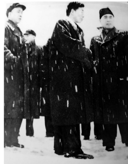
周恩来冒着大雪考察荆江大堤