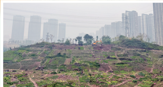
正在整治的荒坡

重庆晨报民生在线 扫码关注 难事、烦事、委屈事、 不平事、新鲜事告诉 我们，记者帮你办