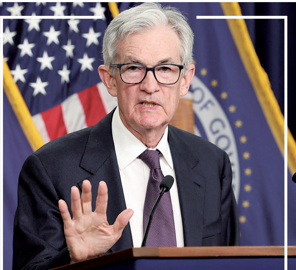
12月18日,美国联邦储备委员会主席杰罗姆·鲍威尔在华盛顿出席记者会。

美国联邦储备委员会18日结束为期两天的货币政策会议,宣布将联邦基金利率目标区间下调25个基点到4.25%至4.50%之间,并预计2025年降息幅度或收窄至50个基点。