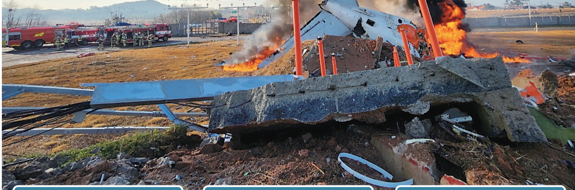
12月29日在韩国务安机场拍摄的事故现场