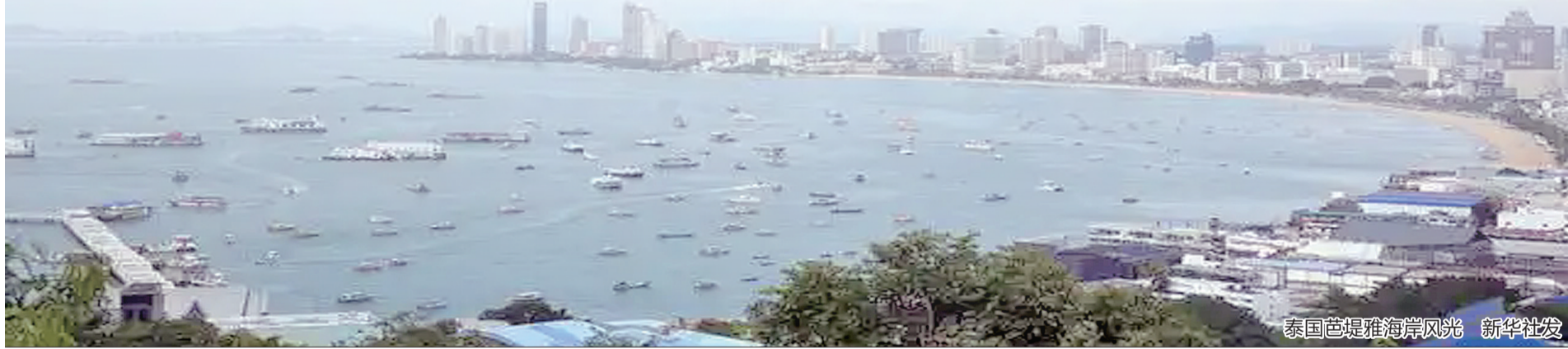
泰国芭堤雅海岸风光