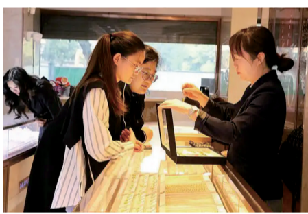
消费者在金店挑选黄金首饰

前往成都旅游。当天,国际黄金创下历史新高,国内多家品牌金店的零售价已涨至846元/克。