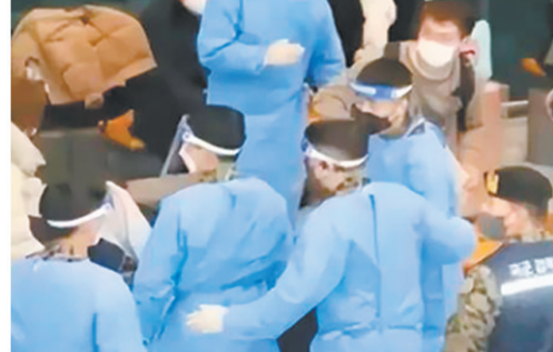
▲全程军警“护送”媒体跟拍