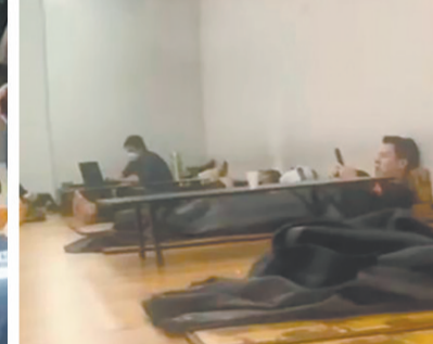
▲隔离被关“小黑屋”睡地板