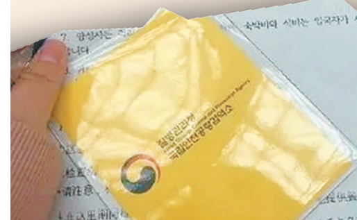
▲中国游客入境韩国后就收到一个黄色牌子