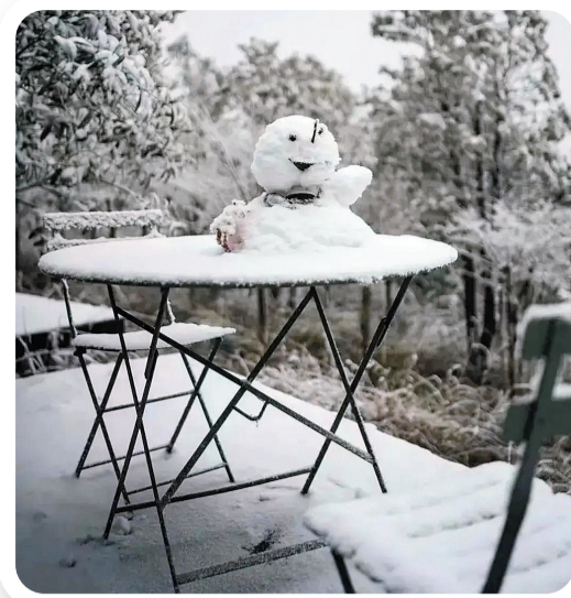
市民堆的小雪人好可爱