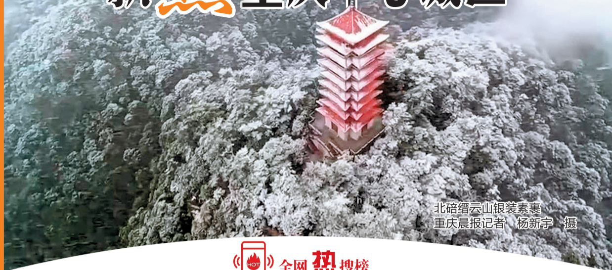
北碚缙云山银装素裹