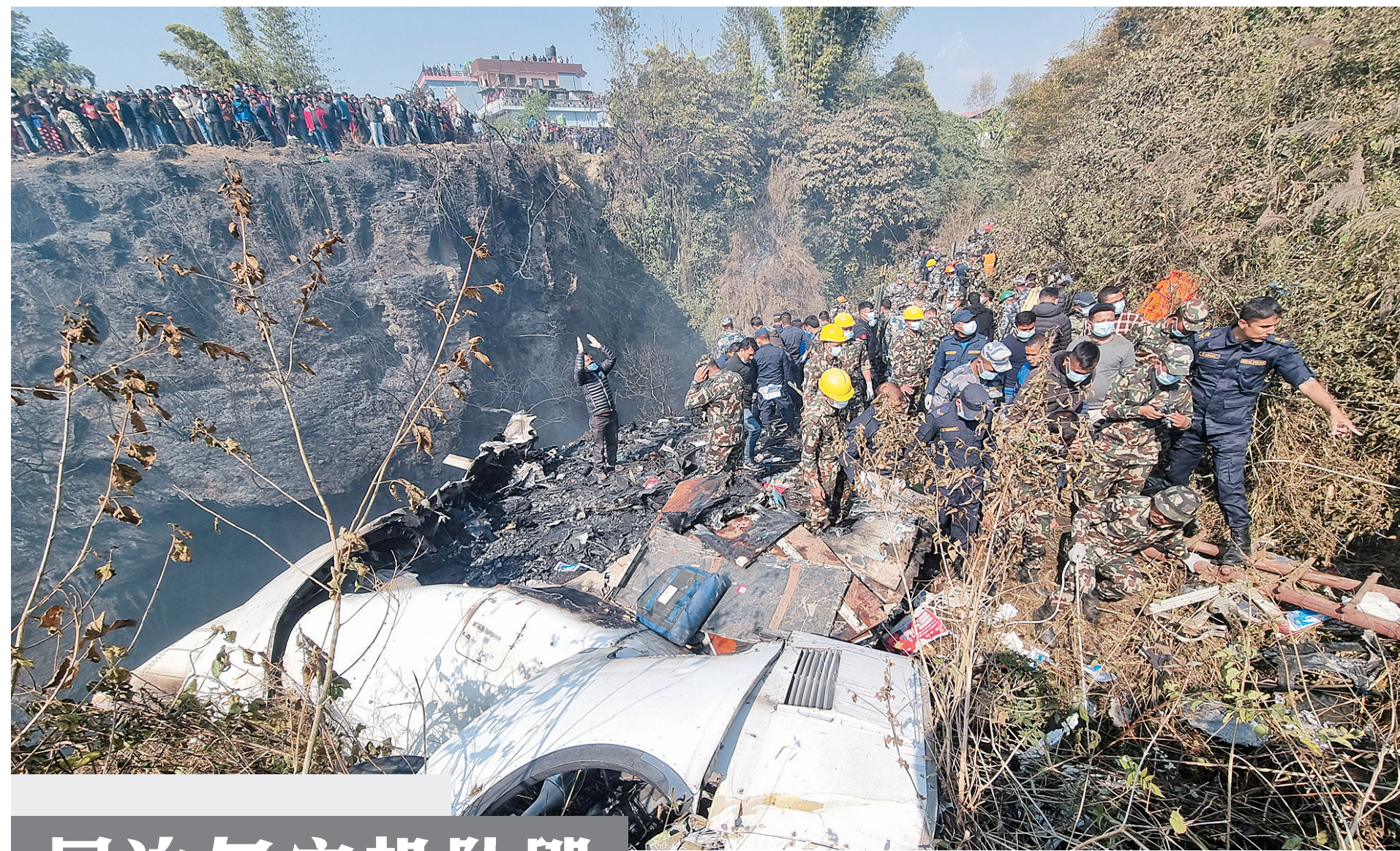
1月15日,救援人员在尼泊尔博克拉地区的坠机现场工作。