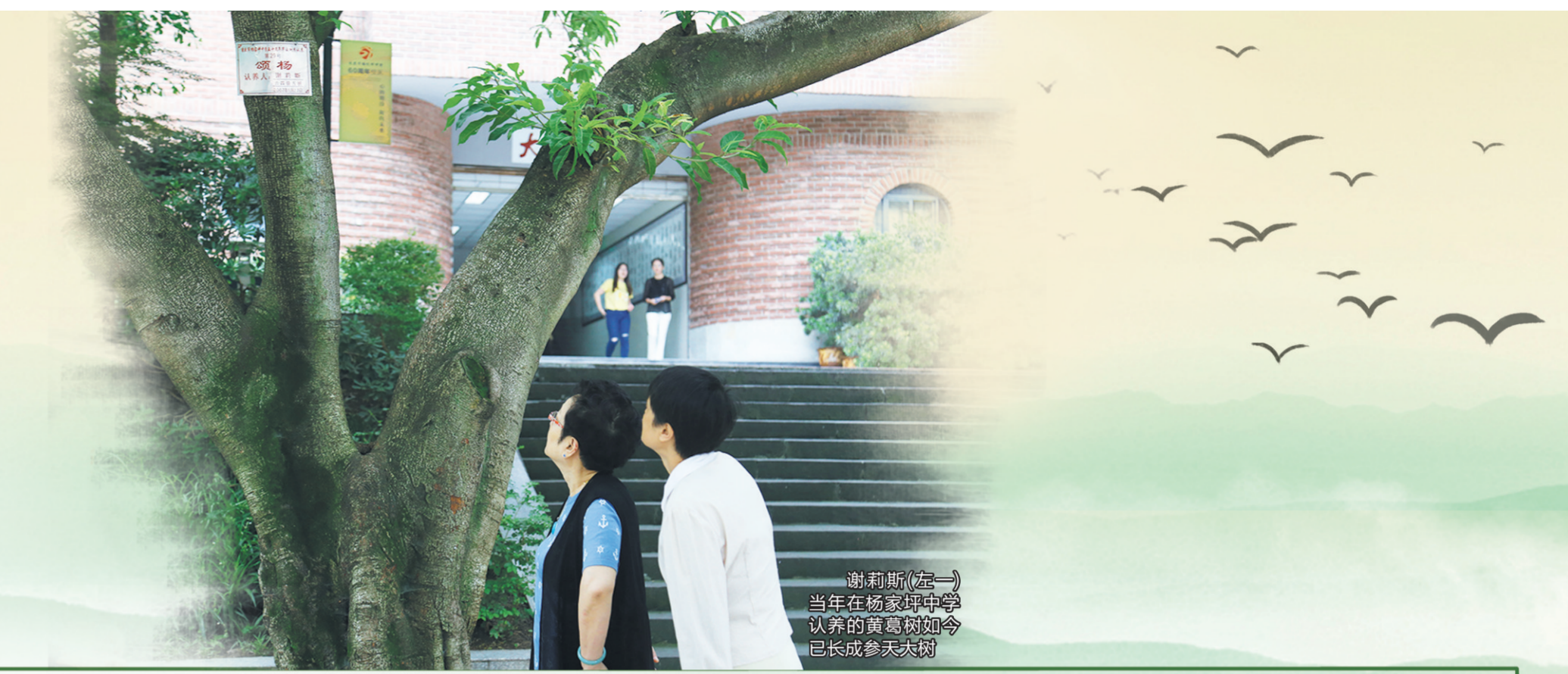
谢莉斯(左一)当年在杨家坪中学认养的黄葛树如今已长成参天大树

“那是外婆拄着杖，将我手轻轻挽，踩着薄暮走向余晖，暖暖的澎湖湾……” 随着这首耳熟能详的歌曲《外婆的澎湖湾》响起，优美的旋律一下子就把我们拉回到上世纪八十年代那个校园歌曲流行的时代，那是一代人的青春与记忆。 2023年1月13日14时零5分，谢莉斯因病在北京逝世，享年75岁。昨天上午遗体火化。随着谢莉斯去世，王洁实、谢莉斯这对有着“黄金组合”之称的男女声二重唱，已成为永恒的绝唱。 谢莉斯演唱的代表作品《校园的早晨》《外婆的澎湖湾》《九九艳阳天》《花儿为什么这样红》等家喻户晓。 谢莉斯，1947年生于重庆，在重庆度过了她的童年和青少年。受歌唱家郭兰英影响，她从小喜欢演唱民歌，17岁考上了中国音乐学院，从此开启了她的艺术人生。成名后的谢莉斯，对重庆的感情依然特别深厚，时常回家乡、回母校探望亲友师长。记者近日专访了几位与她感情甚笃的亲友，听他们说谢莉斯和重庆的故事。