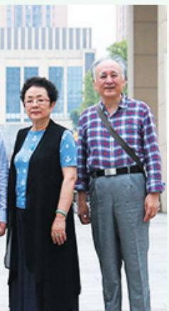
谢莉斯与老公郎文曜

中国女歌唱家，中国电影乐团国家一级演员，享受国务院专家待遇，中央电视台青年歌手大奖赛特邀专家评委、中国音乐家协会会员。 1978年，谢莉斯创新形成了自己的演唱风格，用校园歌曲的方式向中国歌坛介绍并展示了“通俗”唱法。她演唱的校园歌曲走进了千家万户，成为一个时代的印记，并影响了一代青年。