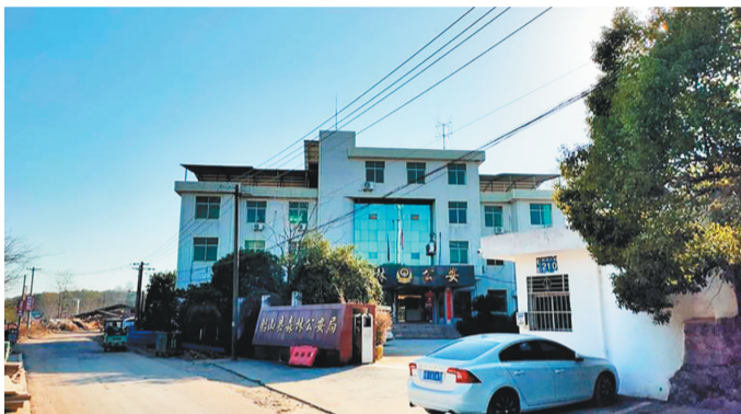
遗体发现所在区域距离铅山县森林公安局150米左右