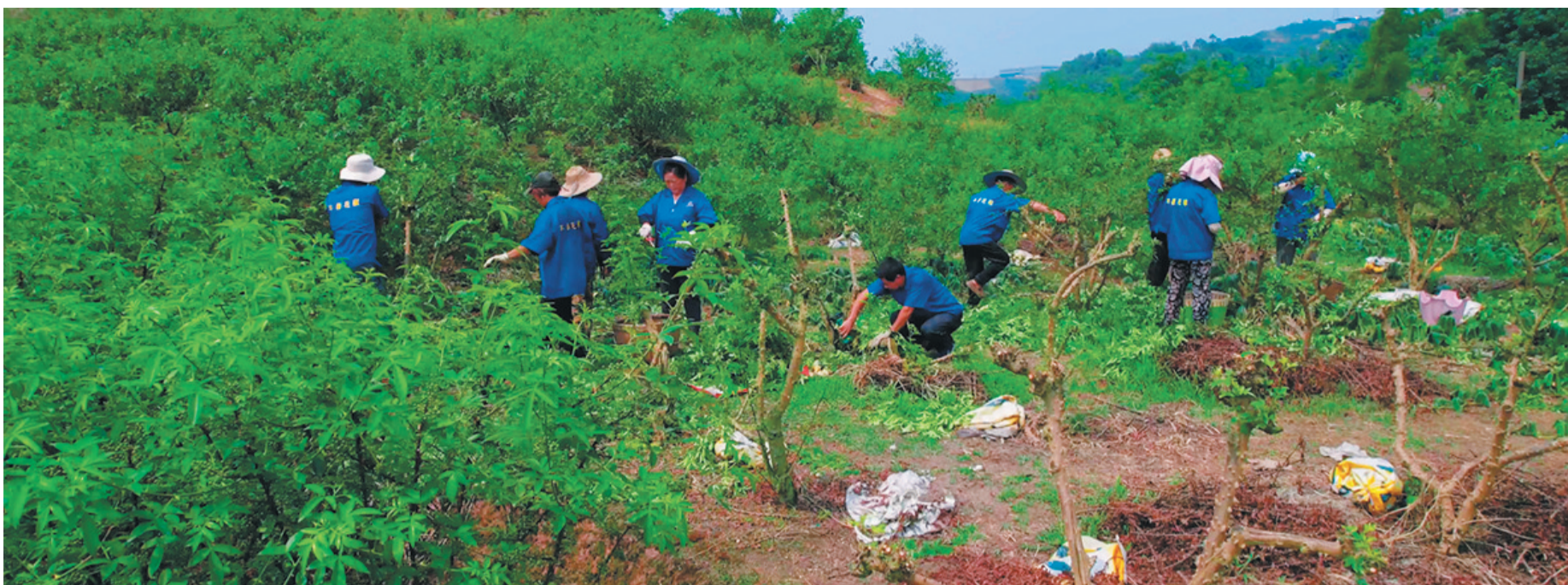
江津花椒出口示范基地