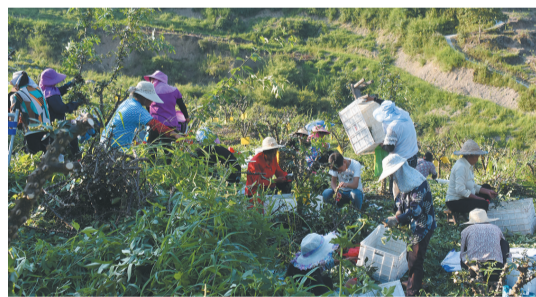
江津花椒出口示范基地