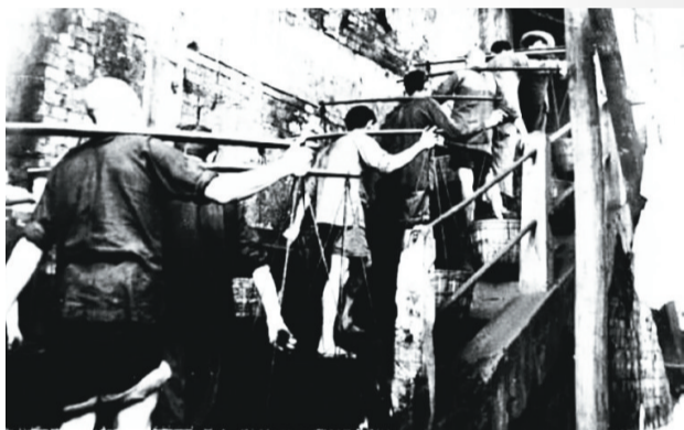
当年，大溪沟发电厂发电用的煤，全靠工人从嘉陵江边挑到厂内

1907年1月9日是重庆总商会长李耀庭的70岁生日，晚上，巴县商人刘沛膏以示庆贺，在重庆城太平门的一间房子里启动他安装的100千瓦发电机，李府院内的50盏电灯绽放光明，照得整个院子和房间如同白昼，一时间成为重庆城轰动的新闻。李耀庭因此成为重庆城第一个用上电灯的人。