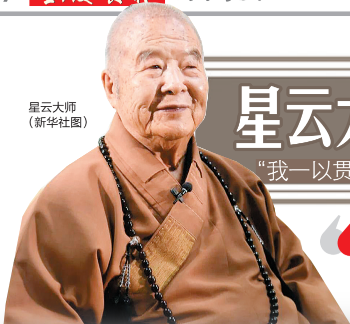
星云大师